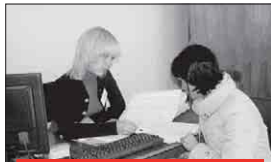
За два місяці адміністратор Єдиного дозвільного центру надає такий обсяг послуг:

видає 400 документів дозвільного характеру зареєстрували 880 заяв надає 1 255 консультацій