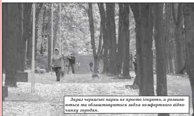
Зараз черкаські парки не просто існують, а розвиваються та облаштовуються задля комфортного відпочинку городян.

Підприємці, які зводять багатопверховий будинок, зобов'язані на прилеглій до будинку території збудувати сучасне дитяче містечко. Таке рішення прийняла міська влада, і відтепер у випадку відсутності у проєктивній документації такого об'єкта підприємство не отримає дозвіл на будівництво. Зразком є дитяче містечко, яке облаштовано по вулиці Смілянській, 2. У цьому дитячому містечку окрім гоїдалок та каруселей є майданчик для гри у волейбол та баскетбол.