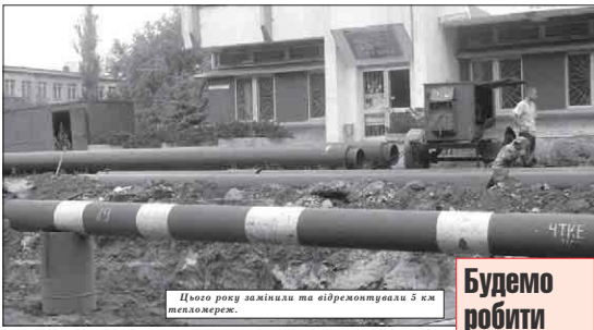
Цього року замінили та відремонтували 5 км тепломереж.

Мільйони гривень із бюджету йшли на погашення заборгованості за газ. Щоріку здебільшого перед початком опалювального сезону міська влада вдавалася до непопулярних заходів, виділяючи "Черкаси-теплокомуненерго" з бюджету по 6-8 млн. грн. на погашення заборгованості за газ. Це ті кошти, які можна було б спрямувати на розвиток міської інфраструктури, підтримку малобазисних та інше.