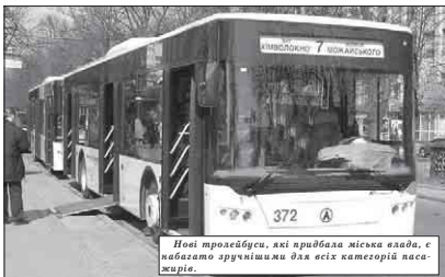
Нові тролейбуси, які придбала міська влада, є набагато зручнішими для всіх категорій пасажирів.

У Черкасах на 32 автобусних маршрутах працює 21 приватний перевізник та комунальне підприємство "Черкаси-електротранс" на 8 маршрутах. Щодня на маршрути міста виходять 350 автобусів та 60-70 тролейбусів.