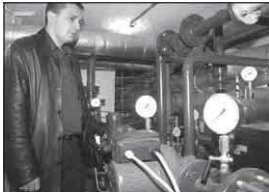
У Львові, наприклад, мєська влада вже почала на практиці запроваджувати енергозберігаючі технології. За останні шість років у Львові застали 60 тисяч між-контактів. У найбільшій чотирьох-рівній мєській планувачі встановили індивідуальні теплові пункти в 1255 будинках. Проект коштує 91 млн. грн. Для жителями будинків економлять в опаленні та теплопостачанні становить 10-15%

Для вирішення усіх цих завдань мєська влада має намір отримати кредит Європейського банку реконструкції та розвитку (ЄБРР) на 11,2 млн. євро та випустити муніципальні облігації на 65 млн. грн. Ці кошти планують спрямувати на запровадження енергозберігаючих технологій. Зокрема, буде частково замінено тепломережі, утеплено фасадні та дахи, встановлено лічильники та індивідуальні теплові пункти у підвалах житлових будинків. Крім того, за рахунок облігації планують модернізувати та утеплити усі лікарні, школи та дитячі садочки.