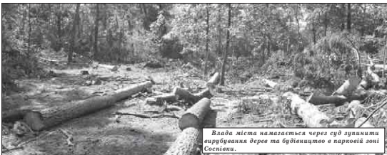
Влада міста намагаться через суд зупинити вирубування дерев та будівництво в парковій зоні Соснівки.

Кількість сміття повністю збільшувалася. Сміттєзбиральні машини не встигали вивозити сміття, оскільки його обсяги постійно зростали, зокрема, через велику кількість пластикової тари у відходах. Також через збільшення будівельних відходів, які люди викидали в контейнери після ремонтів у квартирах. Автопарк комунального підприємства з вивезення сміття застарів — середній строк експлуатації автомобілів 15-18 років. Авто часто замалили, не встигали вивозити сміття.