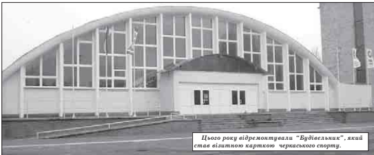
Цього року відремонтували "Будівельник", який став візитовою картою черкаського спорту.

Н евідповідність фінансової влади у розвитку фізкультури та спорту. Тобто галузь фізкультури та спорту фінансувалася за загальною лямпацією. Отож марно було чекати якогось прориву в цьому напрямку.