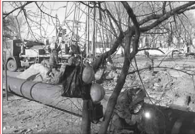
"Черкасиводоканал" виділив понад півмільйона гривень на ремонт водогонних мереж, каналізаційних станцій та інших споруд.

Комунальне підприємство "Водоканал" впроваджує енергозберігаючі технології. Цього року підприємство закінчило роботи з модернізації підвищуючих насосних станцій, які забезпечують цілодобово холодною водою квартири, що розташовані на верхніх поверхах будинків. Це дало можливість майже удвічі економити використання електроенергії. Якщо до впровадження енергозберігаючих технологій насосні станції "намотували" в середньому за місяць 86 тисяч кВт/год, то тепер 38-40 тисяч кВт/год. Загалом заощадження енергоспоживання водоканалу зменшилось на 35%.