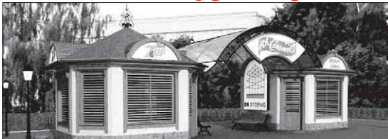
Так виглядатимуть нові зупинки громадського транспорту.