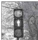
Новий світлофор з електронним цифровим таймером встановили на перехресті вулиць Ільїна та В.Хмельницького

хових будинках. Загалом цього року було майже адцчі більше відремонтовано тротуарів, доріжок та під'їзних шляхів у дворах, ніж торік. У дворах майже нісовісні черкаських будинків було