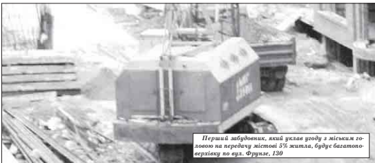
Перший забудовник, який уклав угоду з міським головою на передачу містові 5% житла, буде багатоперспекивою по вул. Фрунзе, 130

О станні кілька років не велось будівництва житла за рахунок міського бюджету. Державне житло зводиться за рахунок коштів із Державного бюджету, а муніципальне не будується вже кілька років поспіль. Тому марно було розраховувати на зменшення черги за рахунок держави.