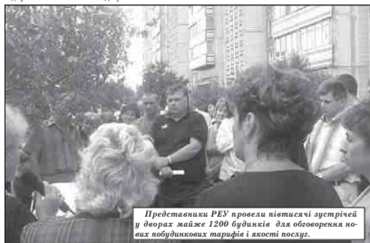
Представники РЕУ провели підписачі зустрічі у дворах майже 1200 будинків для обговорення нових будинкових тарифів і якості послуг.

Цього року на житлово-комунальну галузь міста було виділено 40,5 млн. грн, що на 13 млн. грн. більше, ніж торік.