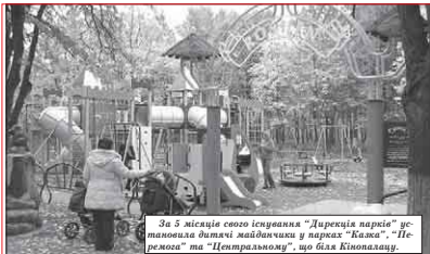
За 5 місяців свого існування "Дирекція парків" установила дитячі майданчики у парках "Казка", "Перемога" та "Центральному", що біля Кінопалацу.

У парках та скверах міста бракувало дитячих майданчиків. За останні кілька років було встановлено лише три сучасні дитячі майданчики, зокрема, у центрі (біля ресторану "Тарангела"), біля магазину "Прем'єр" (вулиця Добровольського) та супермаркету "Гранд" (район Митинця).