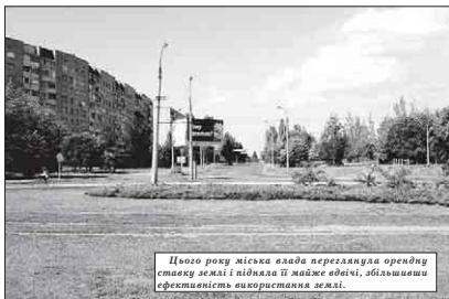
Цього року міська влада переглянула орендну ставку землі і підняла її майже вдвічі, збільшивши ефективність використання землі.

Черкаси мають 200 га комерційних земель вартістю 450 млн. грн. А також 1 300 га промислових земель вартістю понад 3,5 млрд. грн.