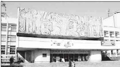
Позиція міської влади така — кому б не належав Палац культури, не повинен змінюватися його функціональне призначення.

Ціна продажу комунального майна зросла удвічі. Загалом цього року було продано 10 об'єктів комунальної власності. Від про-