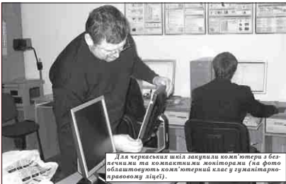
Для черкаських шкіл закупили комп'ютери та безпечними та компактними моніторами (на фото облаштовують комп'ютерний клас у гуманітарно-правовому ліцеї).

У місті Черкаси є 42 школи, в яких навчається 27,5 тисячі дітей. 36 шкіл утримується міським бюджетом, тут навчається 26,7 тисячі дітей. 2 школи-інтернати перебуває на утриманні обласного бюджету, 4 школи є приватними. Також у місті є 53 садочки.